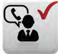
ให้คำปรึกษาทางโทรศัพท์*