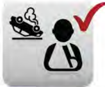
ค่ารักษาพยาบาล ผู้ขับขี่ และ ผู้โดยสาร