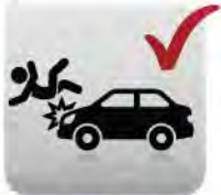
รับผิดชอบชีวิต และ ทรัพย์สิน ต่อบุคคลภายนอก