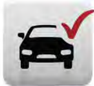
คุ้มครองรถคู่กรณี